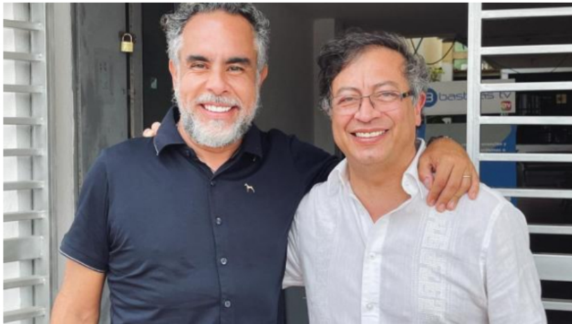
Armando Benedetti y Gustavo Petro.