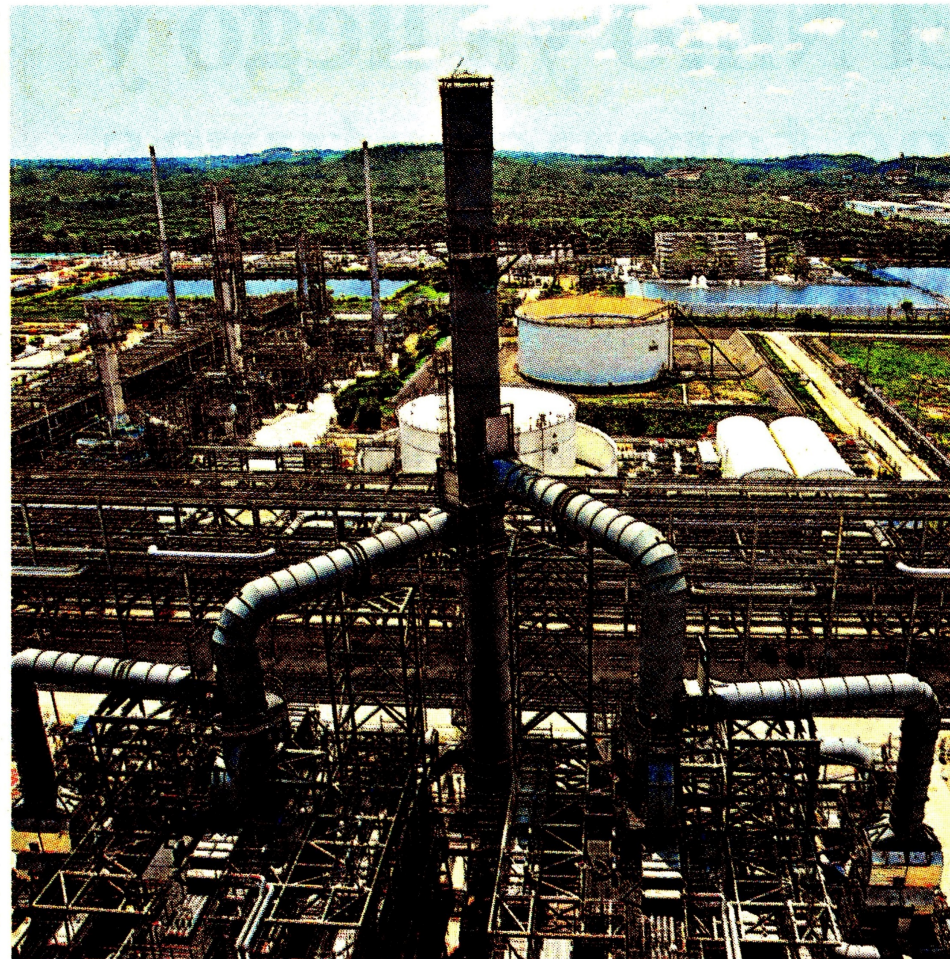
La obra estaba programada para durar 3 años y se tardó más del doble.

tán analizando las 500 páginas que conforman el fallo para definir todos los alcances sobre los que se falló.