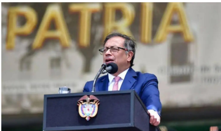
La aprobación de Petro llegó al 26 %, la cifra más baja desde que llegó a la Presidencia.

"Este Gobierno está pasando aceite y en las elecciones de octubre la gente debe pronunciarse sobre lo que pasa en el país y lo que debería venir para Colombia", dijo Carrasquilla.