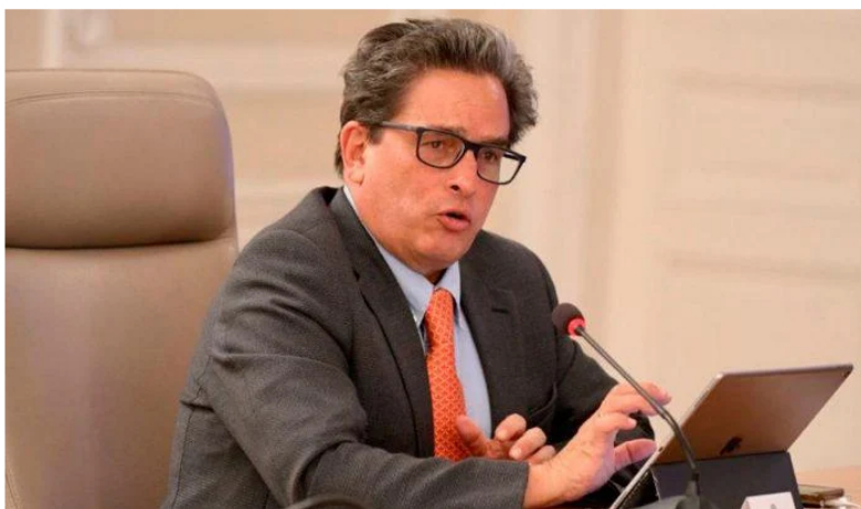
Alberto Carrasquilla, exministro de Hacienda, habla del gobierno Petro.

Alberto Carrasquilla, exministro de Hacienda y ex codirector del Banco de la República, se destacó contra el gobierno del presidente Gustavo Petro.