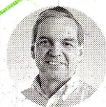
Ricardo Bonilla Ministro de Hacienda y Crédito Público