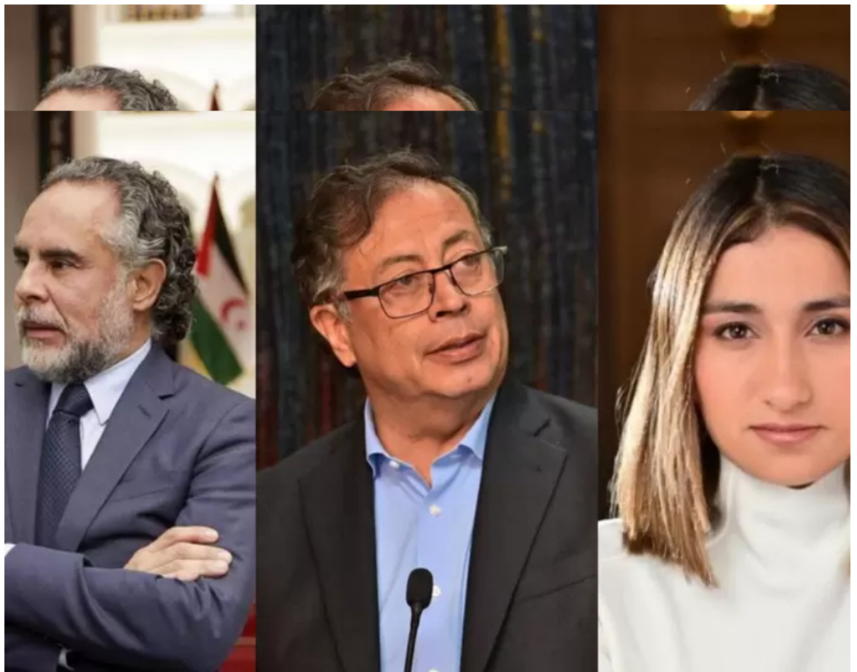
Gustavo Petro, Armando Benedetti y Laura Sarabia