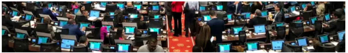
Plenaria de la Cámara de Representantes.