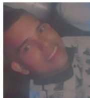
Video íntimo de joven pareja es viralizado en redes sociales