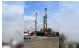
Ecopetrol y Repsol lideran nuevo hallazgo de crudo en el pozo Tinamú-1