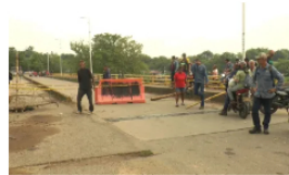
Segundo día de bloqueo por fuga de gas en Campo Gala