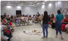
Ecopetrol refuerza formación a 152 docentes de Barrancabermeja