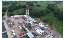
Admiten acción de tutela para suspender la licencia de proyecto de Fracking en Puerto Wilches