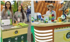
Programa "Ecopetrol emprende" impulsa ideas de negocio