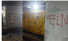
Hombres armados dejan grafitis del ELN en pozo Petrolero de Yondó