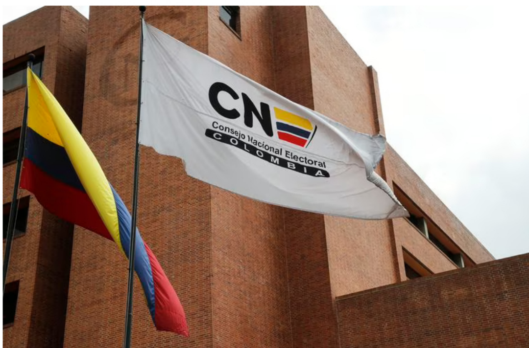
Imagen de referencia del Consejo Nacional Electoral (CNE).