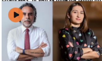
Presidente Gustavo Petro anunció la salida de Laura Sarabia y Armando