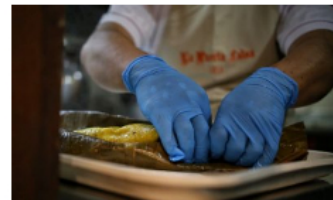
El PAE promoverá la participación de madres, padras y las IAC en su