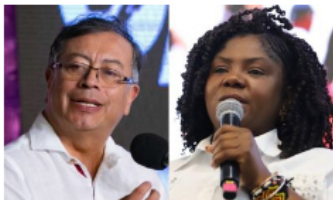
Francia Márquez: «Presidente Gustavo Petro, estamos firmes en