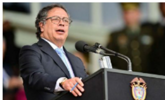
Gustavo Petro: «Yo no acepto chantajes ni uso la política como un