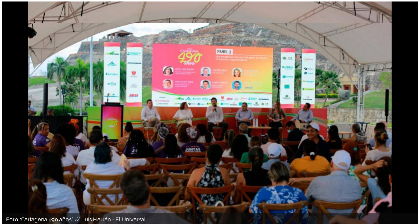
Foro 'Cartagena 490 años'

El foro "Cartagena 490 años" convocó a la ciudadanía a pensar de forma conjunta en el futuro de la ciudad, que en diez años estará celebrando su quinto centenario y hoy tiene muchos retos por delante.