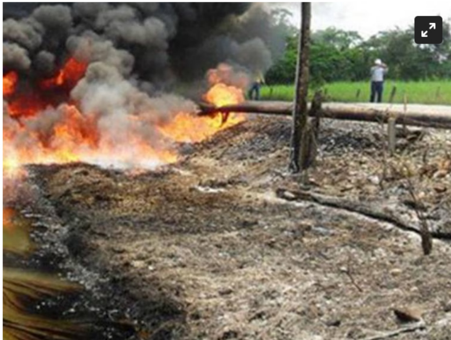
Atentado al oleoducto Trasandino en Nariño, activan plan de contingencia | Imagen de referencia.