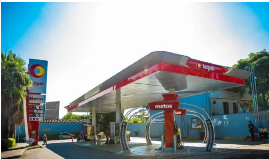
Estaciones de servicio de Terpel.

Finalmente, Terpel informó que no existen costos materiales asociados a la constitución de esta sociedad.