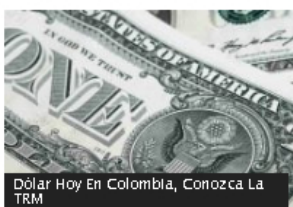
Dólar Hoy En Colombia, Conozca La TRM

Percepción de que el país va por mal camino aumentó de manera notable