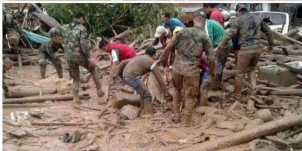
Se desconoce si esta tragedia ha dejado víctimas mortales.

Por su parte, un equipo de la Cruz Roja Colombiana Seccional Norte de Santander, arribará hasta este lugar y entregará 100 mercados, e igual cantidad de kits de aseo, cocina, cobijas y hamacas, para esta población