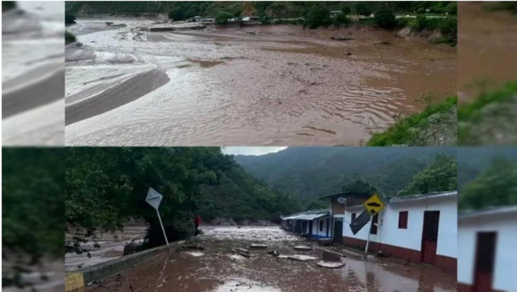
La zona más afectada es El Tarrita.

Esta emergencia se registró en horas de la madrugada, tras la afectación de la laguna El Molino, ubicada entre los municipios de Villa Caro y Ábrego, la cual destruyó algunas viviendas de las veredas Remolino, Paramillo, Brisas del Tarra y El Tarrita.