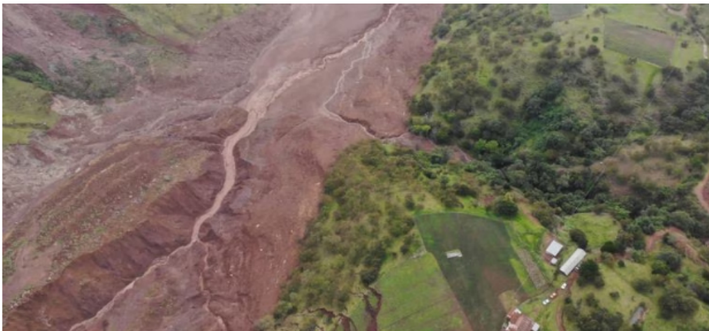
Emergencia en Villa Caro.

Los municipios afectados por esta emergencia son: Villa Caro, Ábrego, La Playa, Hacarí, San Calixto, La Gabarra del municipio de Tibú y Ocaña.