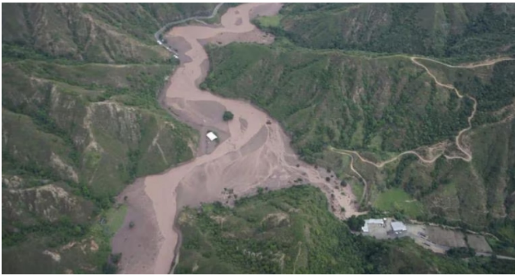
Lo que se alcanza a ver entre el lodo es el techo del coliseo de la escuela.

De igual forma, se está adelantando el levantamiento de la evaluación de daños y análisis de necesidades para establecer el censo de familias y las afectaciones de la población, así como la articulación con las entidades operativas para las labores de rescate de al menos 72 personas.