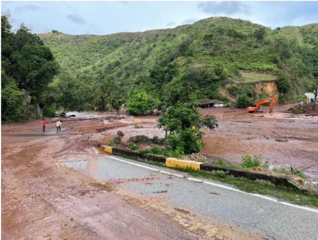
Las imágenes son desgarradoras.

“Necesitamos hacerle frente a esta situación y hacerle un llamado a toda la ciudadanía para que esté alerta a las lluvias. Hemos instalado una sala de crisis 24/7 que permita monitorear a todos los municipios con el apoyo de otros organismos”, indicó Silvano frente a la emergencia.