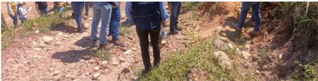
Visita técnica de las autoridades pertinentes.

Ante esta situación, la empresa que suministra el agua en Cúcuta dio a conocer que estos derrumbes han puesto en riesgo un tramo de la tubería principal de 39 pulgadas, que alimenta la Planta de Tratamiento del Carmen de Tonchalá, en donde se produce la cuarta parte del agua potable que abastece la ciudad.