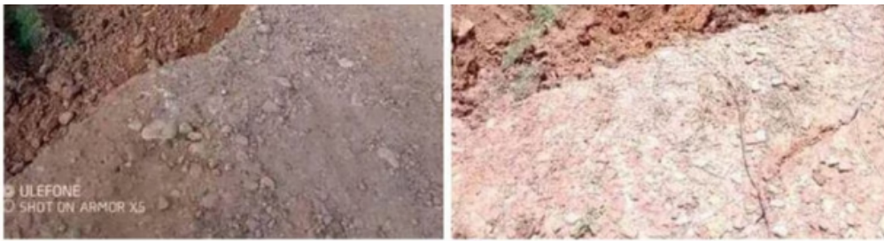
Derrumbe en San Cayetano.

Sin embargo, una semana después de este colapso, la Secretaría Departamental de Gestión del Riesgo de Desastres y de Vías , realizó una visita técnica en conjunto con funcionarios de la Alcaldía Municipal de San Cayetano , Procuraduría Provincial , EIS , Corponor , Ecopetrol , Policía , Aguas Kpital y Alcaldía de Cúcuta para analizar las afectaciones generadas por la pérdida de banca y posible afectación del acueducto metropolitano de Cúcuta.