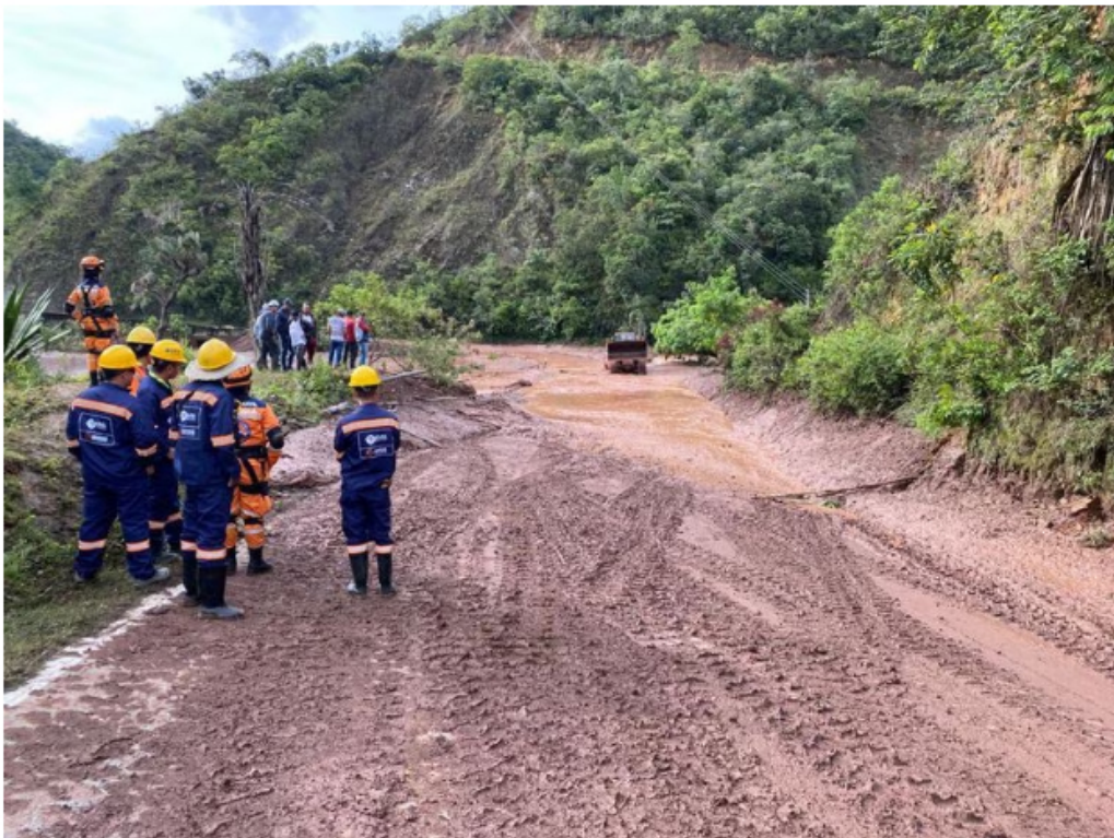
Las autoridades trabajan en la emergencia.

De igual forma, se está adelantando el levantamiento de la evaluación de daños y análisis de necesidades para establecer el censo de familias y las afectaciones de la población, así como la articulación con las entidades operativas para las labores de rescate de al menos 72 personas.