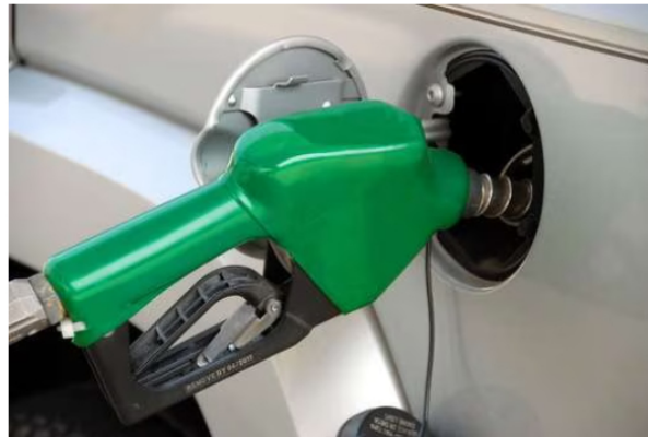
El precio del galón de gasolina sube $600 a partir de este sábado.