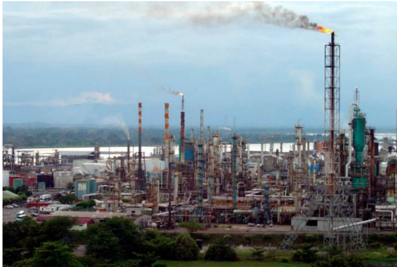
En el cuarto mes del año se reportaron dos avisos de descubrimiento en el pozo Tinamú-1, del contrato de E&P CPO 9, a cargo de la empresa Ecopetrol S.A., y el pozo Dividivi-1, del contrato E&P VIM-33, operado por la empresa OIL& GAS S.A.S

Según la Agencia Nacional de Hidrocarburos (ANH), la producción de petróleo durante abril de 2023 fue de 782.277 barriles promedio por día (bopd), mayor a la registrada en el mismo mes de 2022 cuando alcanzó los 752.079 barriles promedio por día.