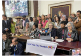
Pacto Histórico acudirá a la CIDH por persecución de la Procuraduría