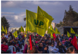
Pronunciamento del Partido Comunista ante las declaraciones de Mancuso