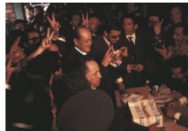
19 de abril de 1970: La historia de un fraude