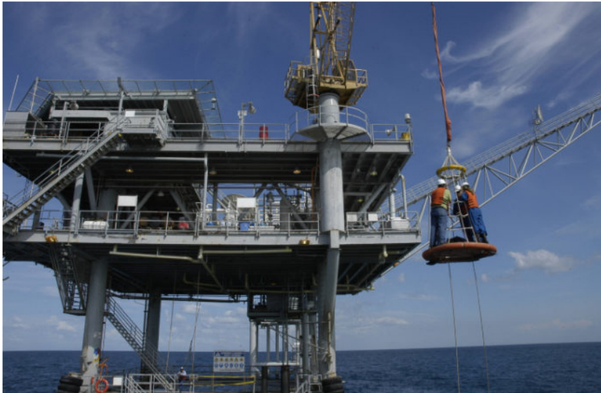
Plataforma Chuchupa para la extracción de gas, a 11 millas costa afuera del departamento de La Guajira.

El presidente de la USO César Loza habla de producción energética, proyectos de inversión social, incremento salarial y estabilidad laboral para los trabajadores de Ecopetrol y sus empresas contratistas