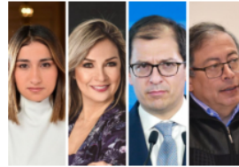
De la guerra psicológica al golpe blando