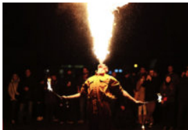
Un elefante se balanceaba sobre las industrias culturales