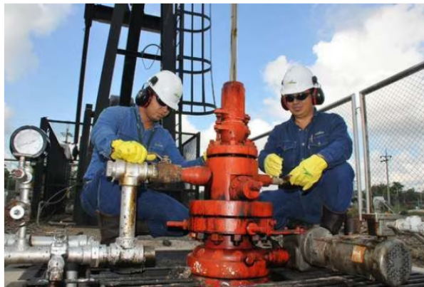
La producción petrolera en el país se mantiene deprimida y en abril apenas creció 4%.