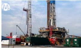
Descubren nuevo yacimiento de petróleo en Castilla la Nueva