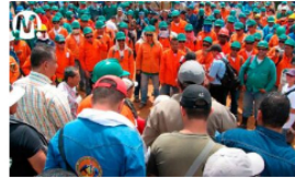
Ecopetrol y la USO lograron acuerdo para mejorar condiciones laborales