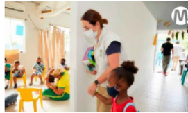
Brisas del Guatiquía tendrá Centro de Desarrollo Infantil