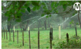
Ecopetrol recibió premio por estrategia de uso sostenible del agua