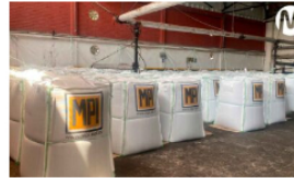
Ecopetrol exportó el primer cargamento de asfalto con plástico reciclado en el país