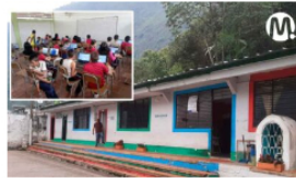
Ecopetrol entregó 60 computadores en colegios rurales del Meta