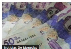
Noticias De Monedas

Para junio, volvió a bajar tasa de usura en Colombia