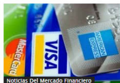
Noticias Del Mercado Financiero

Aprobado en primer debate, proyecto de ley para impulsar el