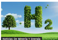
Noticias De Minería Y Energía

Aprobado en primer debate, proyecto de ley para impulsar el