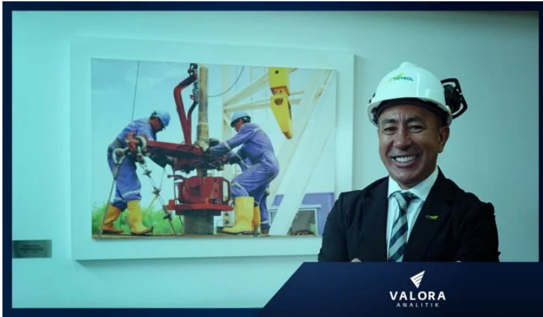
Ricardo Roa Barragán, presidente de Ecopetrol .

El presidente de Ecopetrol , Ricardo Roa Barragán, expuso cuál será el rol del gas natural en las apuestas que tiene la compañía en materia de crecimiento y transición energética, política del Gobierno de Gustavo Petro.