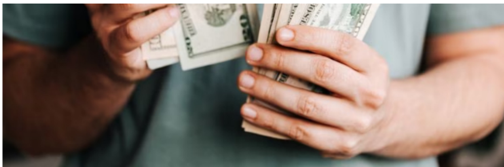
El dólar en Colombia ha registrado valores muy volátiles durante este inicio de año.

La prima de riesgo país ha tenido un comportamiento parecido al del precio del dólar. Esta prima, medida por los Credit Default Swaps (CDS), es el sobreprecio que paga un país para financiarse en los mercados, en comparación con otros. “En marzo de 2021, el CDS a cinco años de Colombia estaba alineado con el promedio de Brasil, Chile, México y Perú, y se encontraba alrededor de 115 puntos básicos (pbs). Sin embargo, el estallido social que tuvo lugar en abril y mayo de 2021, derivaría posteriormente en un proceso de inestabilidad política y en la pérdida del grado de inversión del país por parte de las agencias S&P y Fitch. Luego de este evento, el CDS de Colombia se separó del promedio regional y a finales del año 2021 estaba en 168 pbs, lo que implicaba una brecha frente al promedio de sus pares de entre 40 y 65 pbs. Desde mediados de 2022 este diferencial se incrementó de forma significativa. El CDS de Colombia llegó a 371 pbs y la brecha frente a los países de Latinoamérica ascendió a un nivel máximo de 185 pbs”, explica el informe de Corficolombiana. Ahora, el diferencial del CDS de Colombia frente al promedio de sus pares latinoamericanos disminuyó de 185 pbs en noviembre de 2022 a 140 pbs.