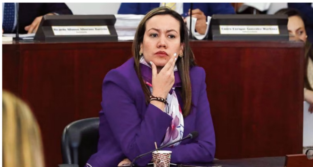
La exministra de Salud, Carolina Corcho.

Por otra parte, ese deterioro de la gobernabilidad llevó al presidente Petro a realizar ajustes en su gabinete, siendo lo más relevante las salidas de José Antonio Ocampo y Carolina Corcho de las carteras de Hacienda y Salud, respectivamente.