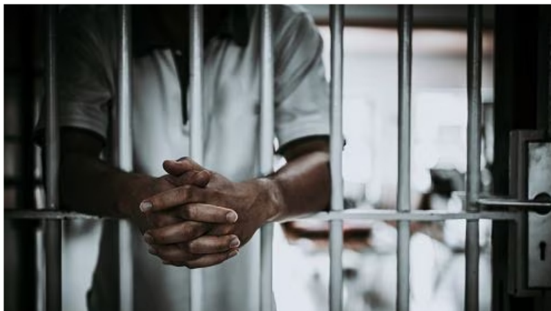
Luis Pachón fue sentenciado a 10 años y 10 meses de prisión, además de ser multado con una suma equivalente a 272 salarios mínimos mensuales legales vigentes (Imagen de referencia).

Para el ente acusador, esta condena es un ejemplo de la lucha contra la corrupción en el país y sirve para enviar un mensaje claro de que aquellos que cometan este tipo de delitos enfrentarán las consecuencias legales correspondientes.