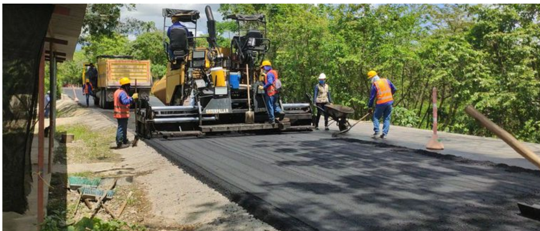
ecopetrol Invertirá multimillonarios recursos en el mejoramiento vial del país.

Los recursos pretenden arreglar 51,5 kilómetros de vías urbanas y terciarias, además que se dotarán unos 660 colegios con implementos digitales y recreativos, sumado a la instalación de más de 300 celdas solares que beneficiarán comunidades rurales.