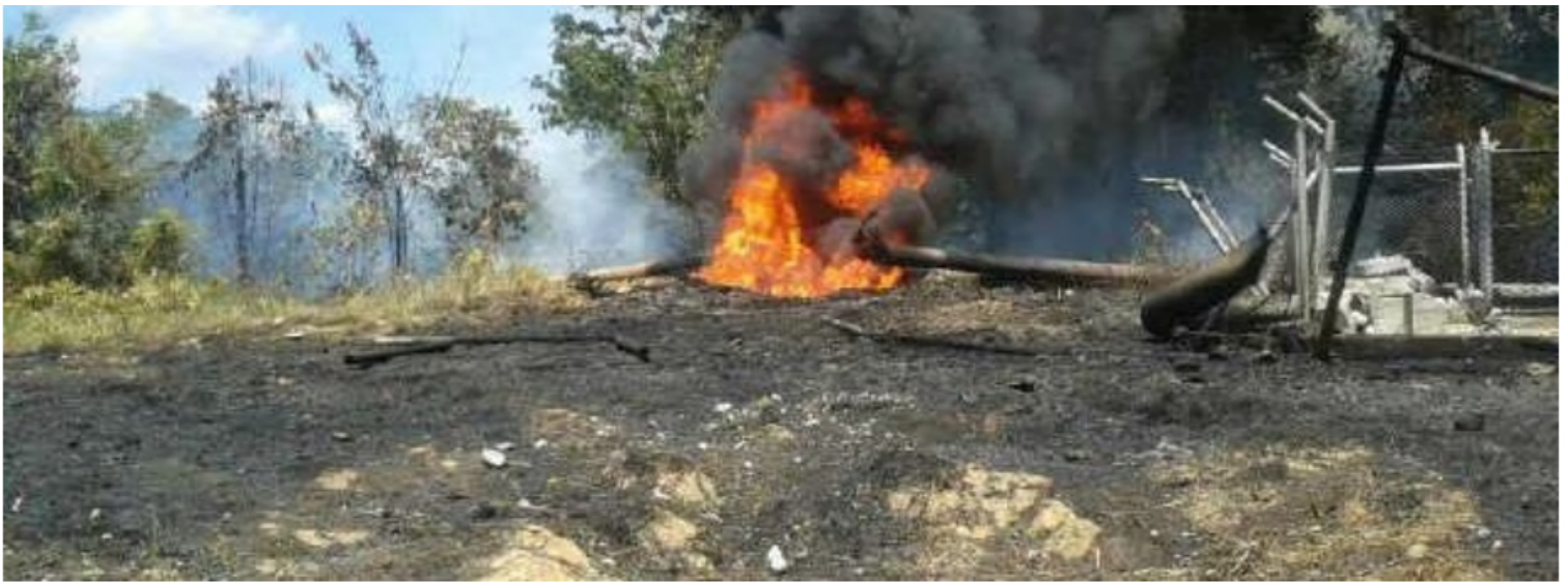
El oleoducto Caño Limón-Coveñas, que conduce crudo desde Arauca hacia Sucre, es el más importante del país.

Además de haber rechazado los constantes ataques de los grupos armados ilegales contra la comunidad, el sector minero energético y la Fuerza Pública. Lamentaron la muerte de un suboficial del Ejército en Tame.