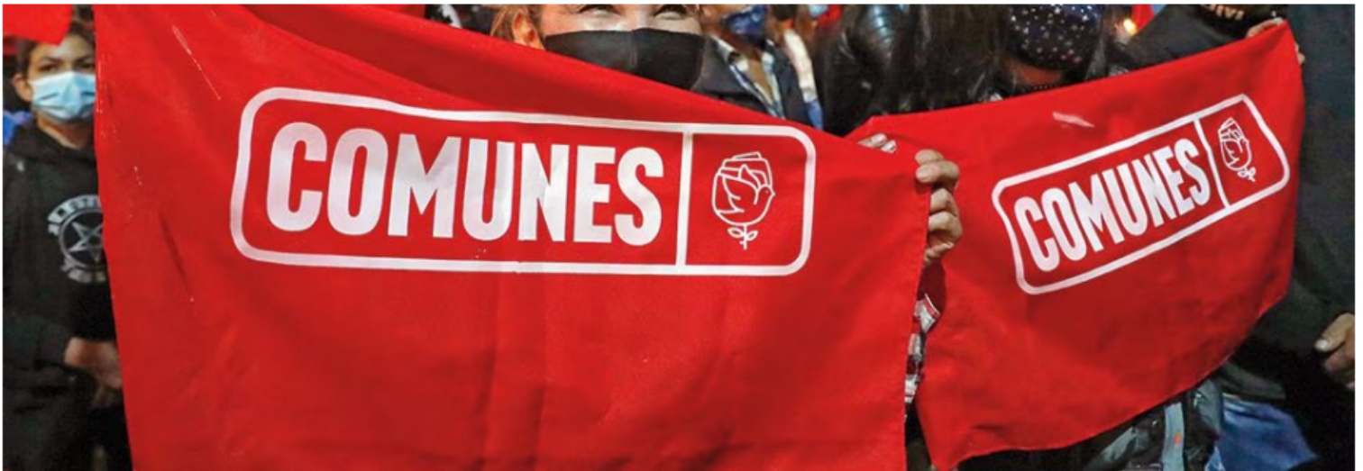
El Partido Comunes es el único que tiene voz y voto sobre quiénes son considerados personal de confianza en la conformación de los esquemas de seguridad y dependencias de la subdirección especializada de la UNP. | Foto: guillermo torres-semana, guillermo torres-semana

La principal petrolera del país sentó su voz de rechazo frente a este tipo de acciones, al tiempo que lamentó la muerte de un suboficial del