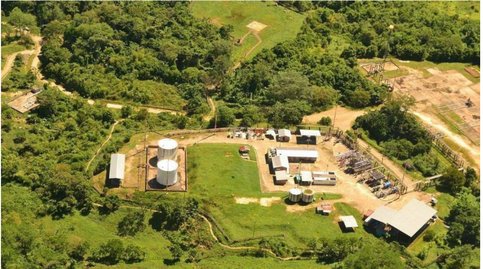
Infraestructura del oleoducto Caño Limón Coveñas, de Ecopetrol.