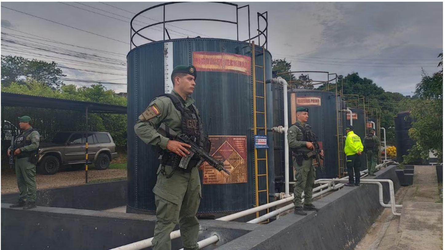
Supuesta multinacional, enredada en el “tumble” a Ecopetrol , funcionaba en una panadería. La Fiscalía estableció que la cadena de empresas metidas en el entramado criminal eran de papel, oficinas fachadas en diferentes ciudades.

Los detalles de la investigación, que conoció SEMANA y que explican la radiografía del millonario hurto a Ecopetrol , dejaron una lista de nombres, funcionarios, contratistas, empresarios, ingenieros y técnicos enredados en la red criminal. Sin embargo, uno llamó la atención.