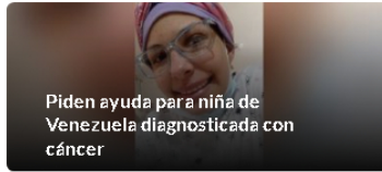
Piden ayuda para niña de Venezuela diagnosticada con cáncer