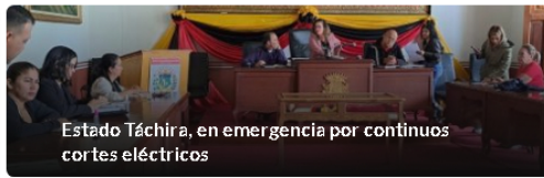
Estado Táchira, en emergencia por continuos cortes eléctricos