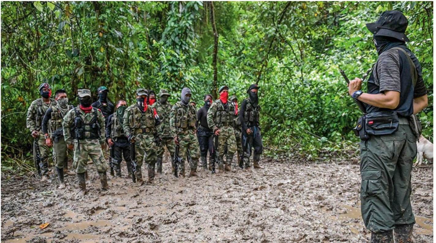
ELN se pronunció sobre su presunta participación en el robo a Ecopetrol: “Son falsas las acusaciones de la Fiscalía”.

29 de julio de 2023 Por: Redacción El País