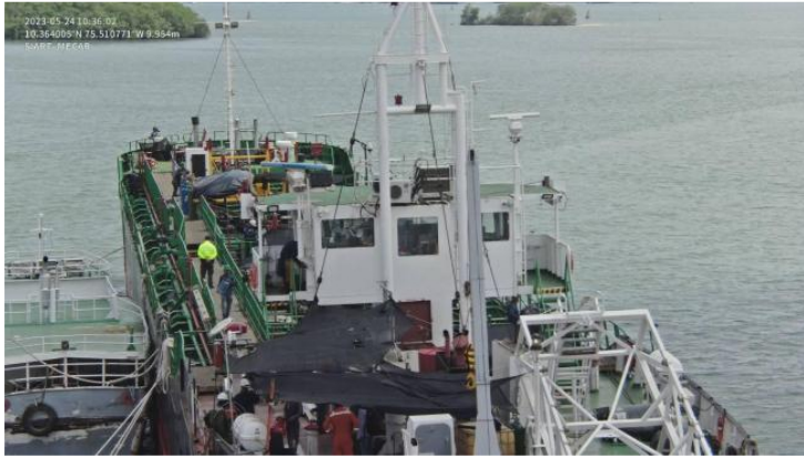
En la investigación participaron agentes de la Dijin.

Desde abril de 2022, medios venezolanos publicaron nombres de firmas colombianas vinculadas a la exportación ilegal de crudo de la estatal Pdvsa , que se enviaba como petróleo residual a Curazao y Panamá. Luego se movía a Swiss Terminal de Barranquilla S.A.S. (de propiedad de Ashmore Management Fund), se mezclaba con el robado y se exportaba como crudo colombiano.