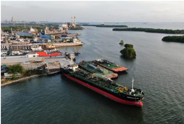
Uno de los buques que fue incautado.

Por GDA | El Tiempo | Colombia - julio 27, 2023