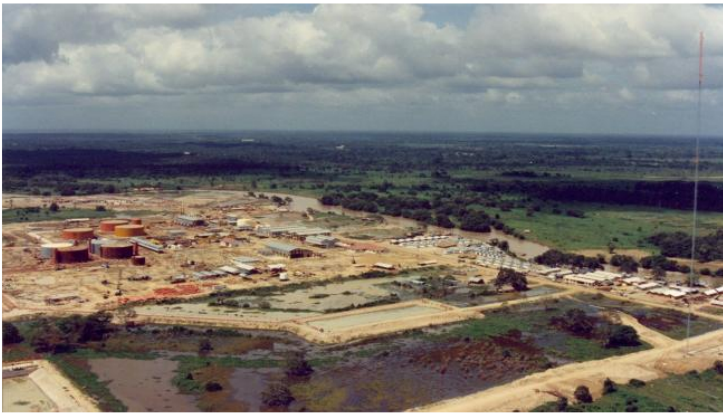
Panorámica del campo petrolero Caño Limón, que opera Occidental de Colombia, en Arauca.

Investigadores dijeron que la cifra entregada por el presidente Petro sobre el monto del saqueo a Ecopetrol es conservadora y que podría ascender a 500.000 millones de pesos mensuales durante años.