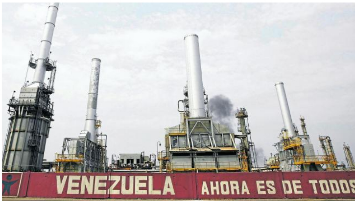
Refinería de la estatal Pdvsa.

El caso llegó hasta la Corte Suprema de Justicia que, en abril de 2021, tuvo que dirimir la asignación de competencia del expediente que solo ahora acaba de reventar judicialmente.