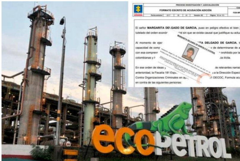
Por ahora, el ente acusador ha incautado bienes pertenecientes a los 17 empresarios que están avaluados en $1,3 billones.