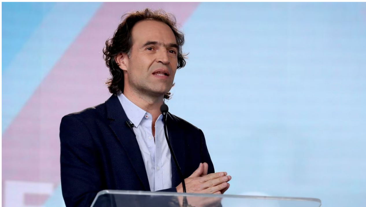
Federico Gutiérrez, candidato a la alcaldía de Medellín.

Federico Gutiérrez, candidato a la Alcaldía de Medellín, se refirió a un tema alrededor del cual giró el debate público esta semana: el robo de crudo que empresarios, en complicidad con el ELN, propinaron a Ecopetrol los dos últimos años y que le representó a la compañía pérdidas por más de 60.000 millones de pesos .