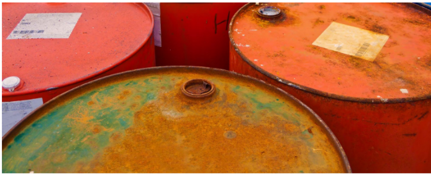
La investigación refleja la extracción ilegal de miles de barriles de petróleo de Ecopetrol.

Antropoceno ha dado inicio: ¿de qué se trata este fenómeno y por qué marcaría el fin de la Tierra como la conocemos?