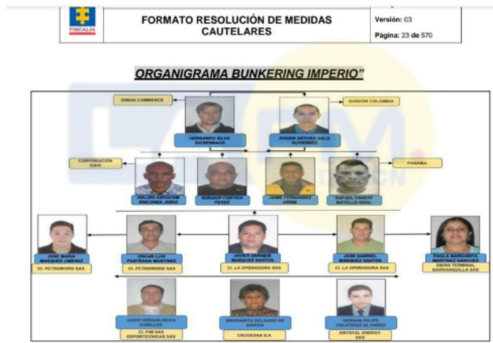
Organigrama de implicado en Megalavado Petrolero Fiscalía General de la Nación

Más información: "Es un robo continuado que involucra a otras administraciones": MinHacienda sobre millonario hurto de crudo