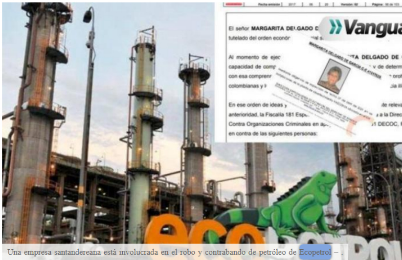
Una empresa santandereana está involucrada en el robo y contrabando de petróleo de Ecopetrol –

‘Bunkering Imperio’ es la red o red de robo de petróleo que la Fiscalía ha documentado en su expediente sobre el presunto robo y contrabando de crudo a Ecopetrol, lo que también demuestra cómo funcionaba esta estructura de corrupción para la captación ilegal de hidrocarburos.