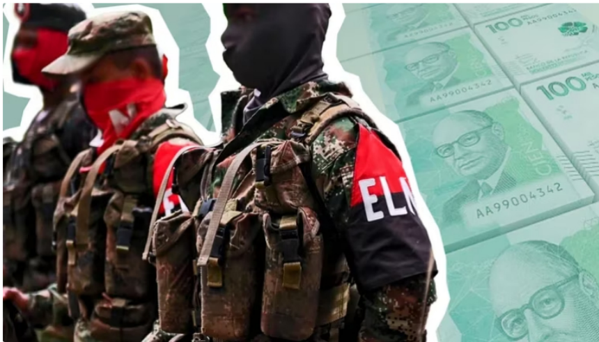
La Delegación de diálogos del ELN se desmarcó del escándalo por el millonario robo a la petrolera estatal. Infobae.

Sobre las 9:23 p. m. del 28 de julio, la Delegación de Diálogos del Ejército de Liberación Nacional (ELN) emitió un comunicado desmintiendo que haya participado en el millonario robo a Ecopetrol , que se denunció el 26 de julio.