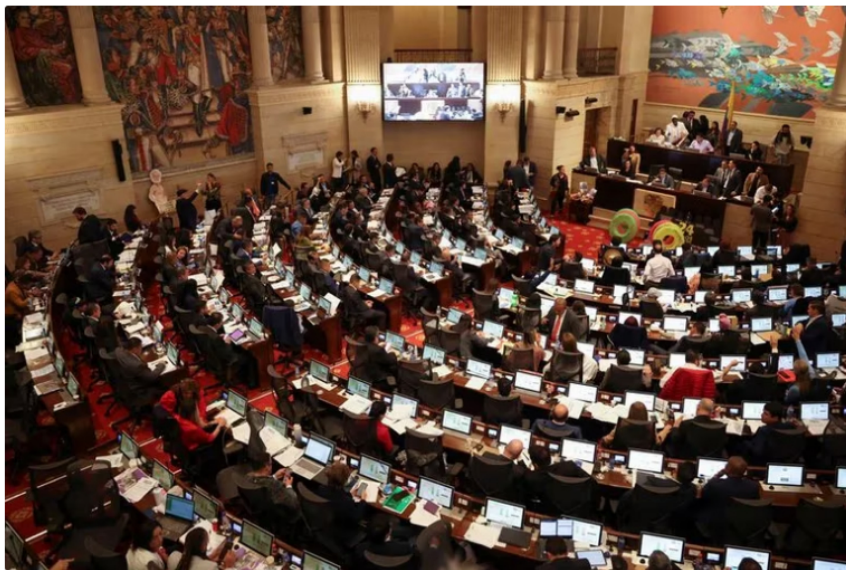
Congreso de Colombia.

El Centro Democrático ha anunciado que llevará a cabo un debate de control político en la Cámara de Representantes debido al escándalo por presunto contrabando y hurto de crudo , que según el presidente Gustavo Petro, podría alcanzar los $360.000 millones .