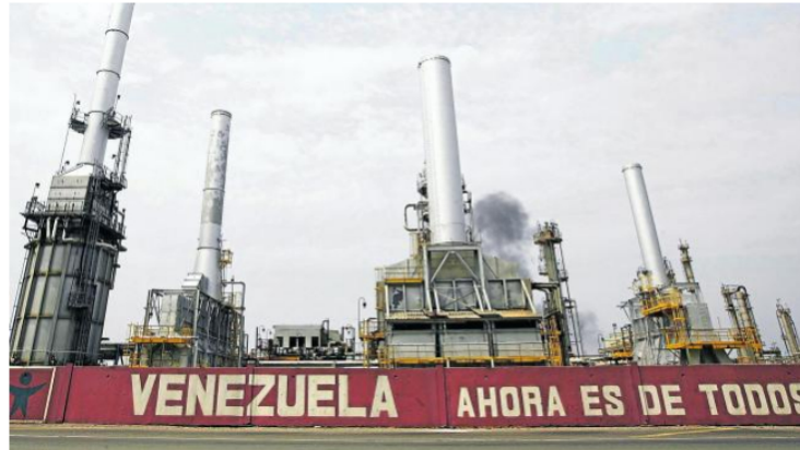
Una de las refinerías de Petróleos de Venezuela,SA (PDVSA)

De hecho, no descartan que ese crudo, de menor calidad, haga parte del escándalo de corrupción que sacude desde hace varios meses al régimen de Nicolás Maduro y a su petrolera estatal.