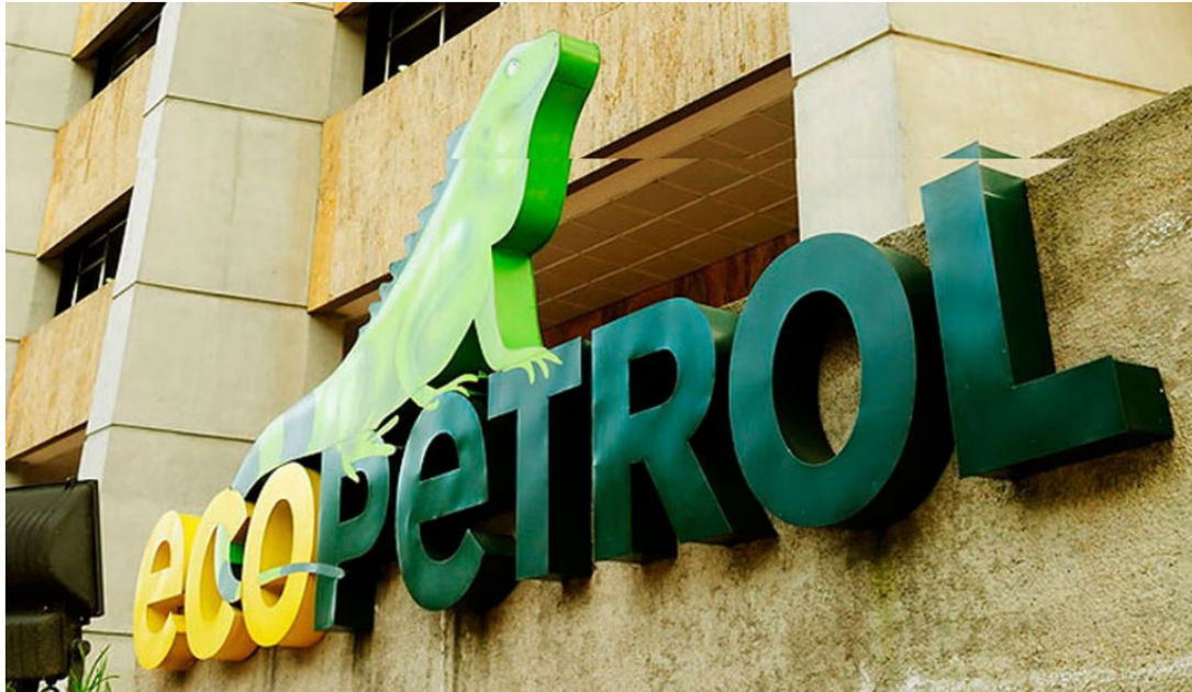
Ecopetrol estaba siendo víctima de robo de crudo por parte de algunos empresarios con complicidad del ELN.

28 de julio de 2023 Por: Redacción El País