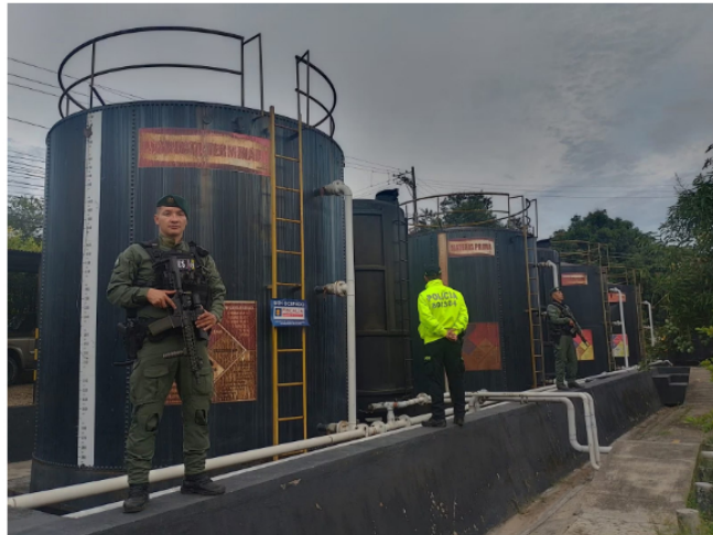
Las acciones de las autoridades han logrado incluso cerrar algunas empresas e infraestructura que eran utilizadas para robar crudo de Ecopetrol .

“Desde el año pasado, Ecopetrol dio por terminada la relación comercial con la única empresa involucrada en la operación ‘Bunkering Imperio’ con la que tenía contratos. Adicionalmente contrató una reconocida firma internacional que luego de adelantar las verificaciones no encontró indicios sobre la participación de funcionarios del Grupo Ecopetrol en estos actos ilícitos”, recalcó Ecopetrol .