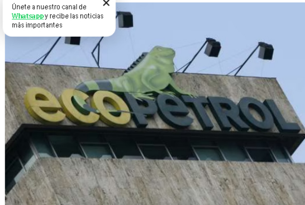
El desfalco que le habría costado a Ecopetrol más de US$80 millones.

Únete a nuestro canal de WhatsApp y recibe las noticias más importantes