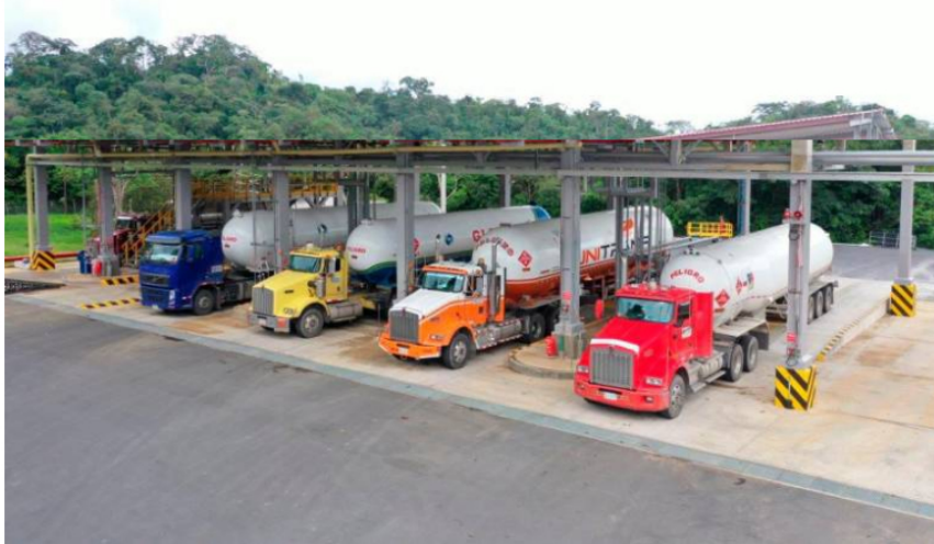
Esta reducción de los precios beneficia a un total de 3,5 millones de familia.

Con la proyección de precios internacionales, se estima que en el segundo semestre del año se mantenga la tendencia a la baja.