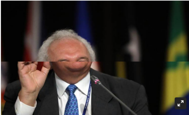
Exministro de Hacienda, José Antonio Ocampo.

José Antonio Ocampo aseguró que el robo de combustible debe ser atacado