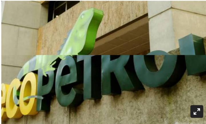
Imagen de referencia, compañía Ecopetrol .

Diez empresarios aparecen en ese entramado de corrupción, Hernando Silva es el principal sindicado hasta el momento