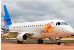
Satena invertirá US$80 millones para la ampliación de su flota

Frente a las investigaciones, Ecopetrol señaló que ha venido trabajando conjuntamente y de manera articulada con las autoridades para prevenir, controlar y perseguir el hurto de hidrocarburos, "producto de lo cual han sido condenadas más de 400 personas, se ha ordenado la extinción de dominio de bienes y se ha logrado el dismantelamiento de organizaciones criminales dedicadas a este delito".