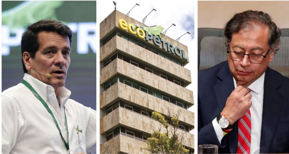
Por multimillonario robo de petróleo a Ecopetrol, que superaría 1.3 billones de pesos, la empresa se declaró "víctima" en el proceso judicial

que pudo haber sido cómplice, no investigaba por qué bajaba por momentos la presión del oleoducto. Eso normalmente sucede cuando el ELN vuela un tramo del tubo, pero ahora el robo explica también que estaba sucediendo esa disminución de la presión cuando estaba pasando y nadie al interior de la empresa se 'mosqueó'.