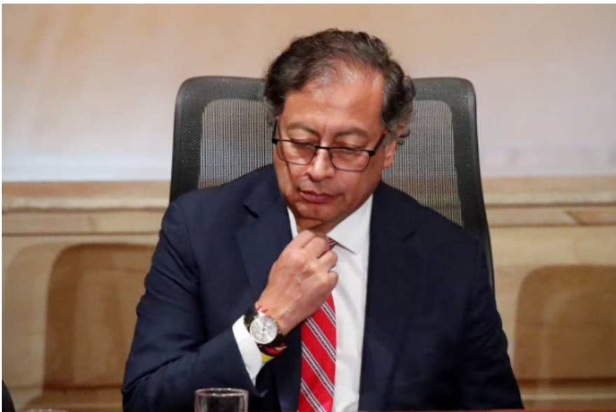
Presidente Gustavo Petro habló de Ecopetrol.

“Esta investigación de la Dijín muestra uno de los mayores robos al estado colombiano. Se robaron cerca de 80 millones de dólares en petróleo y los delincuentes eran ‘gente de bien’ de los sectores más pudientes del país. Debe investigarse si el robo contó con apoyos al interior de Ecopetrol ”, dijo el presidente Petro.