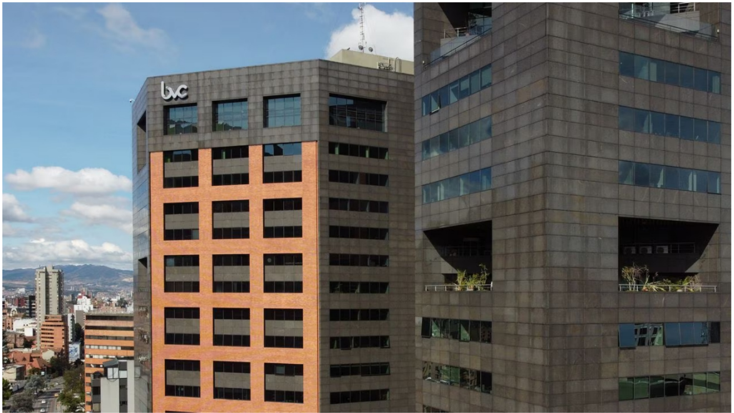
La Bolsa de Valores de Colombia y Ecopetrol siguen afectadas por el mal trago que pasan los operadores tras el nuevo ajuste de las tasas de interés que anunció la Fed en los Estados Unidos.

La Bolsa de Valores de Colombia y Ecopetrol siguen afectadas por el mal trago que pasan los operadores tras el nuevo ajuste de las tasas de interés que anunció la Fed en los Estados Unidos y este jueves -27 de julio- arrancaron nuevamente con caídas en sus diferentes indicadores, que siguen lastrados por la creciente aversión al riesgo y el temor a un mayor endurecimiento de la política económica en Colombia, si el Banco de la República emula los pasos que ya dio el banco central del gigante norteamericano.