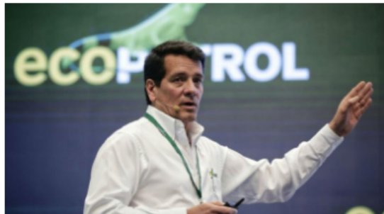
Felipe Bayón, presidente de Ecopetrol . Foto: AFP

Por: Camilo Andrés Jaimes Osorio Jueves, Julio 27, 2023 - 08:56