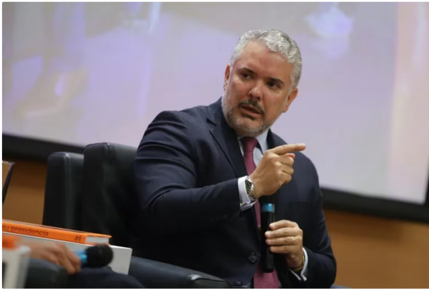
Iván Duque, expresidente de Colombia.

El expresidente Iván Duque reaccionó al escándalo de contrabando de petróleo que involucra a Ecopetrol , que se habría iniciado desde hace varios años y generó pérdidas millonarias para la estatal petrolera.