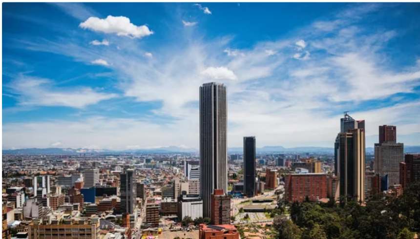
En Bogotá están radicadas las empresas más grandes del país.

Según la Cámara de Comercio de Bogotá , la capital de la República cerró el primer semestre con 695.681 empresas activas , 3,9% más (25.871) frente al mismo periodo del año anterior (669.810). Asimismo, del total de compañías que operan en la ciudad, el 91,3% son microempresas , 7,9% son Pymes (pequeñas y medianas) y apenas el 0,9% son grandes organizaciones.