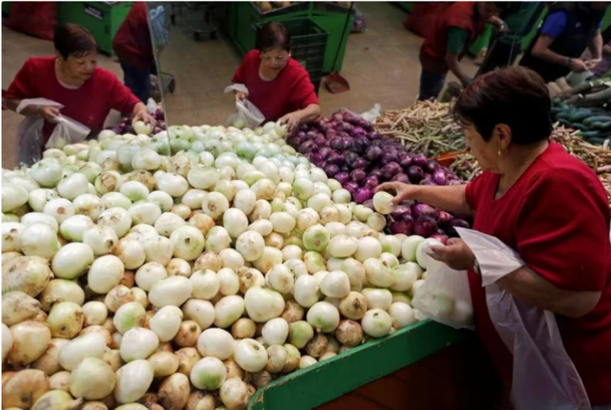
Alimentos (62 compañías), automotriz (47) y salud, química y farmacéutica (44), son los tres sectores económicos que reúnen a las empresas más grandes de la ciudad.

Se destaca que con el paso del tiempo algunos sectores económicos perdieron fuerza , como el caso de las empresas de materiales, que en 2020 eran 44, pero ahora quedan 37, o las de transporte y almacenamiento, que también se redujeron. En contraste, están las compañías de venta de maquinaria y equipos, que aumentaron su presencia en el mercado, ya que hasta hace tres años eran 30 en la ciudad y hoy son 40.