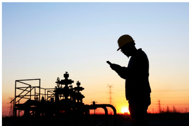
El ELN, que realizó varios atentados, sería el encargado de realizar los cortes en los oleoductos.

Incluso, la alerta llegó desde el exterior y fueron medios venezolanos los que informaron sobre lo que estaba ocurriendo con el tráfico de petróleo en el vecino país.