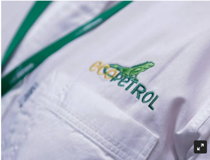
Ecopetrol , imagen de referencia.

El mayor Juan Guillermo Uribe confirmó en La W el robo de 1,3 billones de pesos presuntamente en cabeza de Hernando Silva, quien se consideraba de los principales dinamizadores de compra y venta de hidrocarburos en el país.