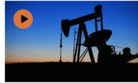
Video: Ecopetrol registró ingresos récord por 119 billones de pesos