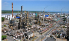
Contraloría dejó en firme fallo fiscal contra Ecopetrol