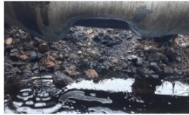
Ya son 11 los ataques a planta de Ecopetrol en Barrancabermeja