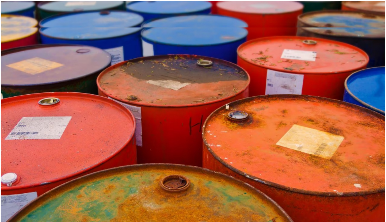
La investigación refleja la extracción ilegal de miles de barriles de petróleo de Ecopetrol.

26 de julio de 2023 Por: Redacción El País